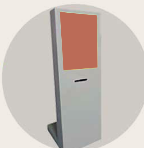
Imagem em modo randômico.