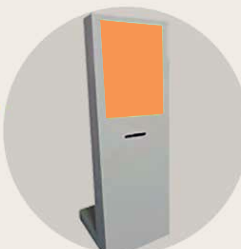
Imagem em modo randômico.